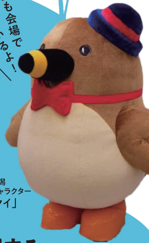
福島潟 マスコットキャラクター 「クイクイ」