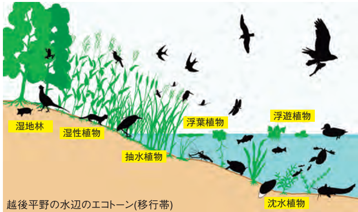
越後平野の水辺のエコトーン(移行帯)