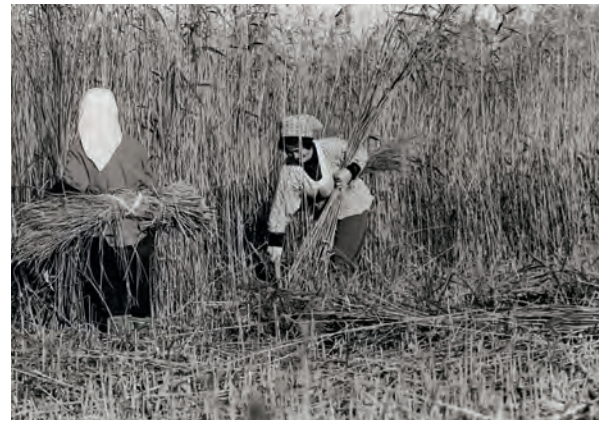
昔のヨシ刈りの様子

現在、生活様式や産業構造の変化に伴い、潟に対する人々の直接的な関わりは減ってきていますが、福島潟のヨシ焼きやヒシもぎ、佐潟の潟普請やヨシ刈りなど、潟環境の保全につながる活動をしている人たちもいます。