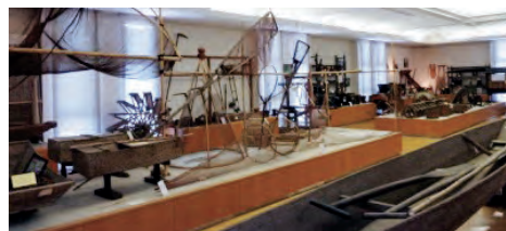
籠潟で使用されていた漁・狩猟用具(潟東歴史民俗資料館)