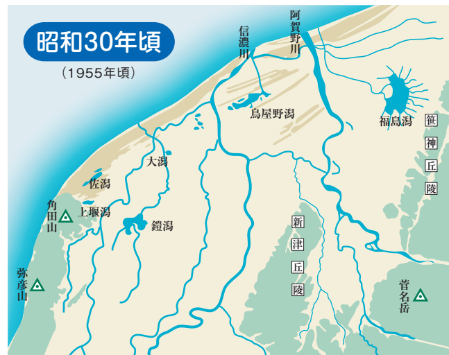
■新潟市発行「新潟市史 通史編1」p.16「越後平野の概観」、新潟市歴史博物館発行「絵図が語る みなと新潟」p.10「戦国時代の三ヶ津と新潟市域のみなど」をもとに作成