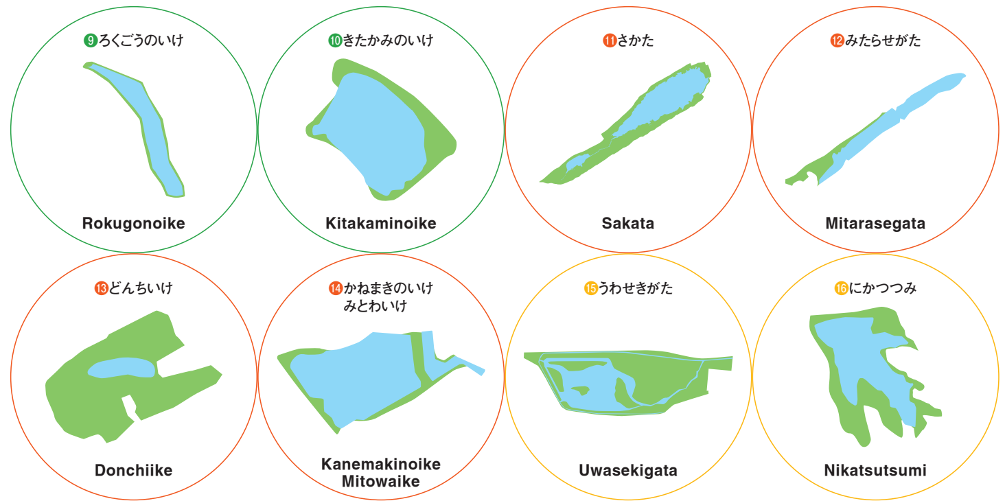
※表紙に掲載の図は、各潟の形を表現するためのものであり、実際の大きさの比率とは異なります。