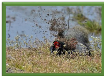
令和4年度銀賞「キジの砂浴び」